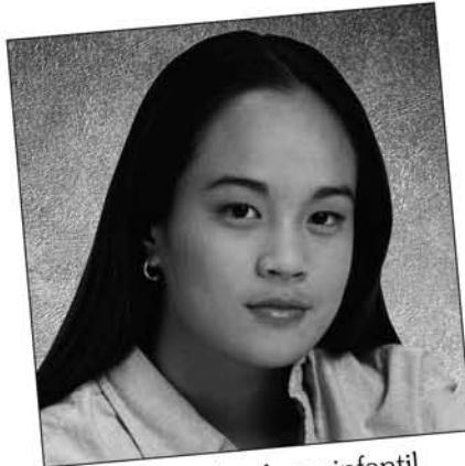
Victima de abuso infantil "Me golpean en mi casa".