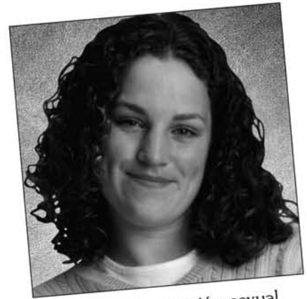
Victima de agresión sexual "He sido violada".