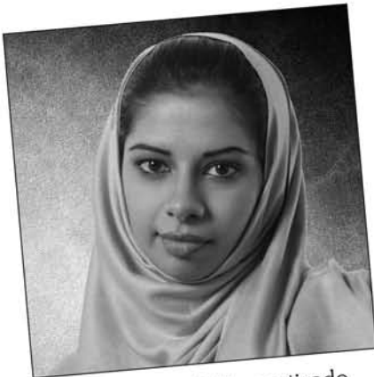
Victima de delito motivado por el odio "Me acosan porque soy diferente".