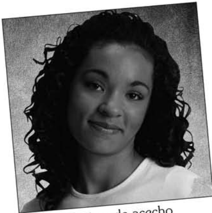
Victima de acoso "Mi ex novio no deja de seguirme".